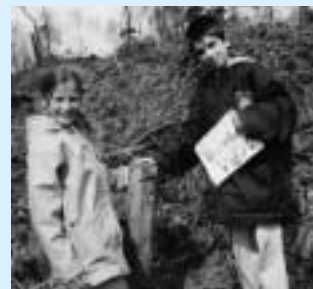
Les jeunes découvrent le sens de l'orientation avec l'Ecole en Vacances.

● Par ailleurs, une vingtaine de jeunes maxévillois de 10 à 14 ans ont pleinement et activement profité de "l'Ecole en Vacances" organisée par la Ville de Maxéville.