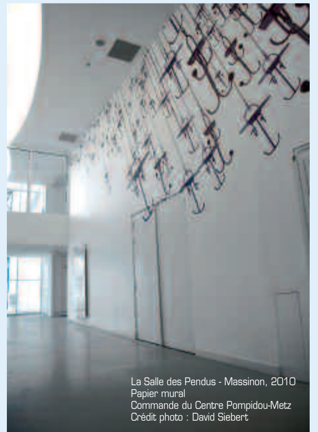
La Salle des Pendus - Massinon, 2010 Papier mural Commande du Centre Pompidou-Metz