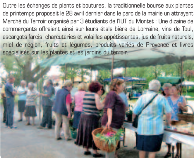
Outre les échanges de plants et boutures, la traditionnelle bourse aux plantes de printemps proposait le 28 avril dernier dans le parc de la mairie un attrayant Marché du Terroir organisé par 3 étudiants de l'IUT du Montet.