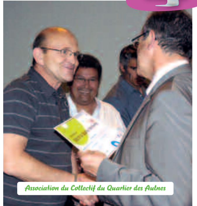
Association du Collectif du Quartier des Aulnes