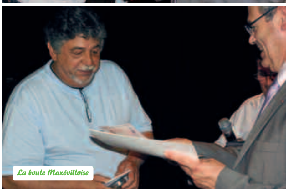
La boule Maxéilloise