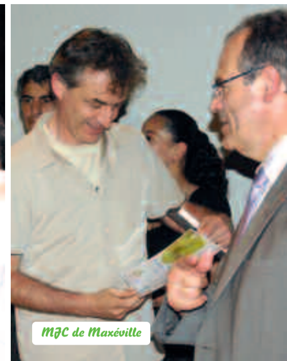
MJC de Maxéville