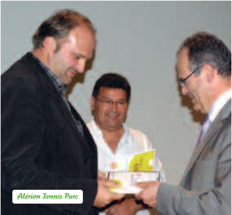
Alérian Tennis Parc