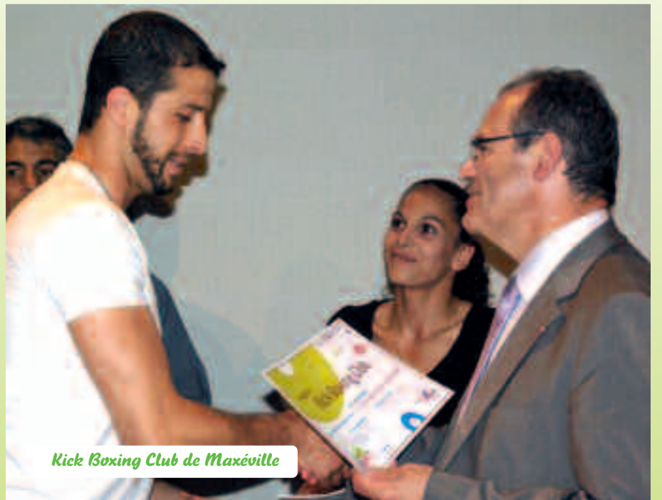
Kick Boxing Club de Maxéville