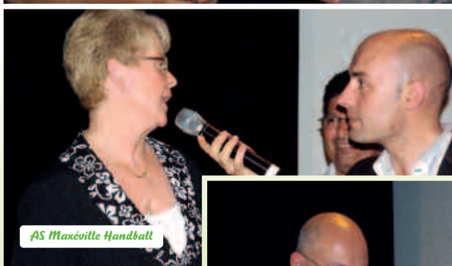
AS Maxéville Handball