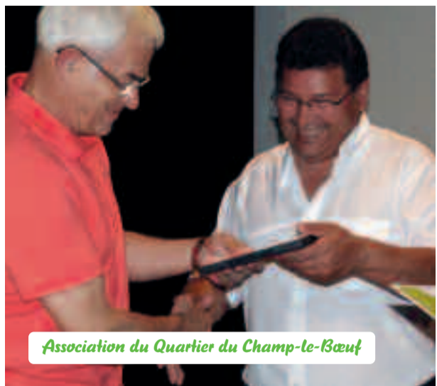
Association du Quartier du Champ-le-Bœuf