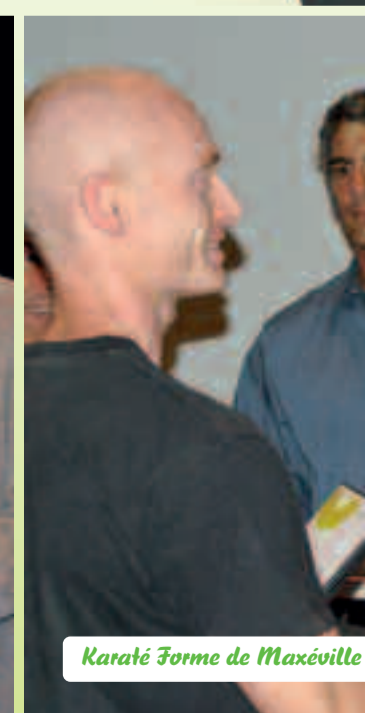
Karaté Forme de Maxéville