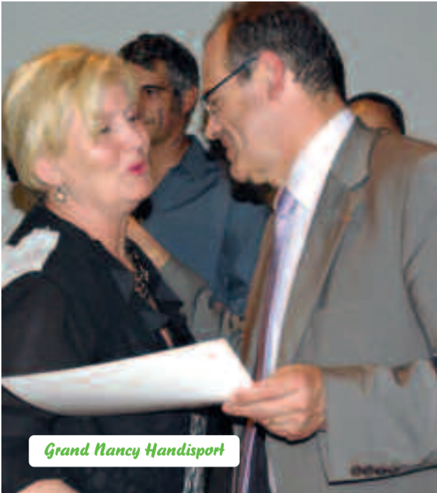
Grand Nancy Handisport