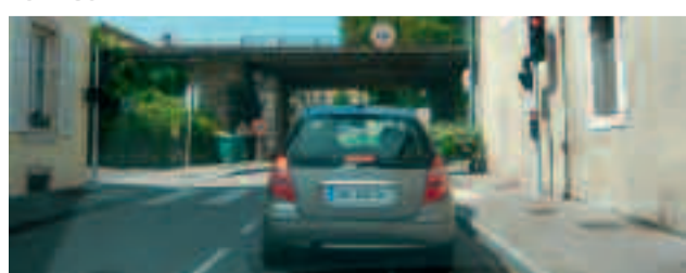
Le conducteur de la seconde voiture arrêtée au feu ne voit pas le panneau ZONE 30.

À l'issue d'investigations menées sur le terrain, quartier après quartier, un dossier précis et détaillé a été monté avec clichés et commentaires à l'appui. Il a été transmis aux instances municipales et communautaires pour examen et mise en œuvre des prescriptions.