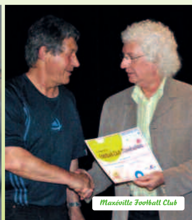
Maxéville Football Club