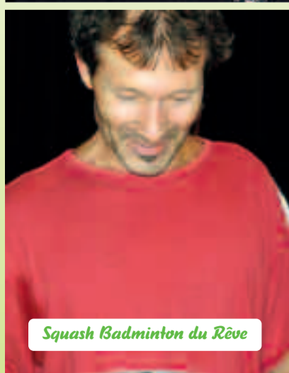
Squash Badminton du Rêve