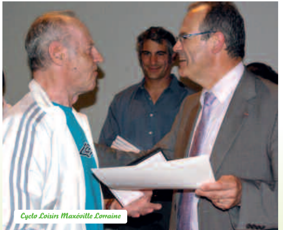
Cyclo Loisirs Maxéville Lorraine