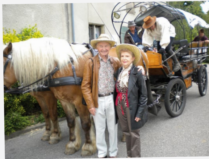
Promenade en calèche avec les participants des ateliers équins-seniors.