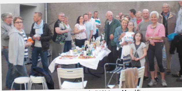
Fête des voisins du vendredi 14 juin, rue Marcel Simon.