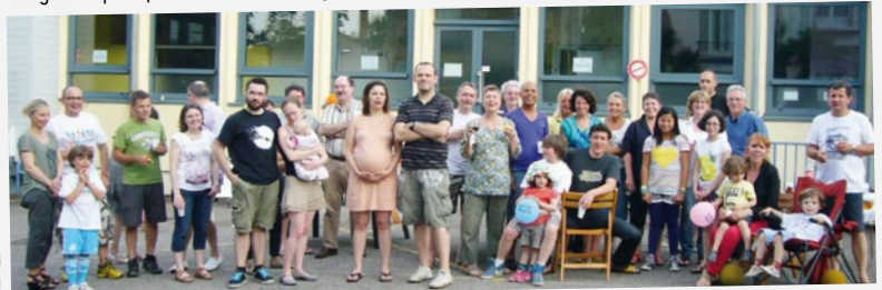
Fête des voisins rue Lyautey.