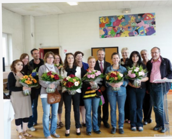
Une manifestation de fin d'année a été organisée pour remercier les équipes éducatives. Des bouquets de fleurs ont été remis aux professeurs des écoles sur le départ.