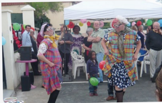
Fête des voisins rue de la Justice.