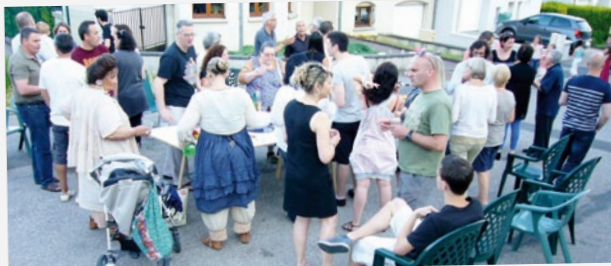
Fête des voisins sur le secteur des Folies.