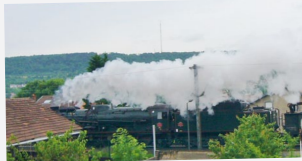
La locomotive à vapeur 241 P 17 de 4000 chevaux, 27 mètres de long et 200 tonnes, est passée par Maxéville.