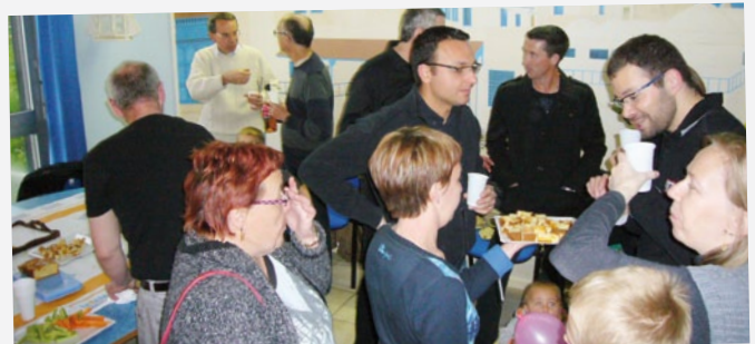
Fête des voisins quartier Hameau de la Ferme.