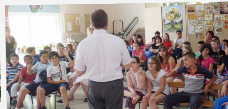
Avant leur entrée au collège, les élèves des écoles Jules Romains et Saint-Exupéry ont reçu un dictionnaire.