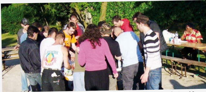
Fête des voisins résidence Jeanne D'Arc, enceinte du Grand Sauvoy.