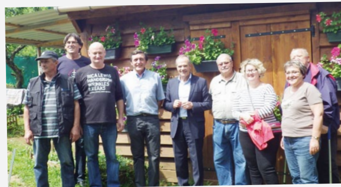
La Municipalité a rendu visite à l'association Max'Jardins.