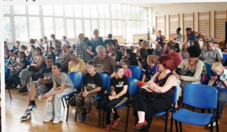
Un dictionnaire a été remis à chaque élève de l'école Vautrin passant en 6 e .