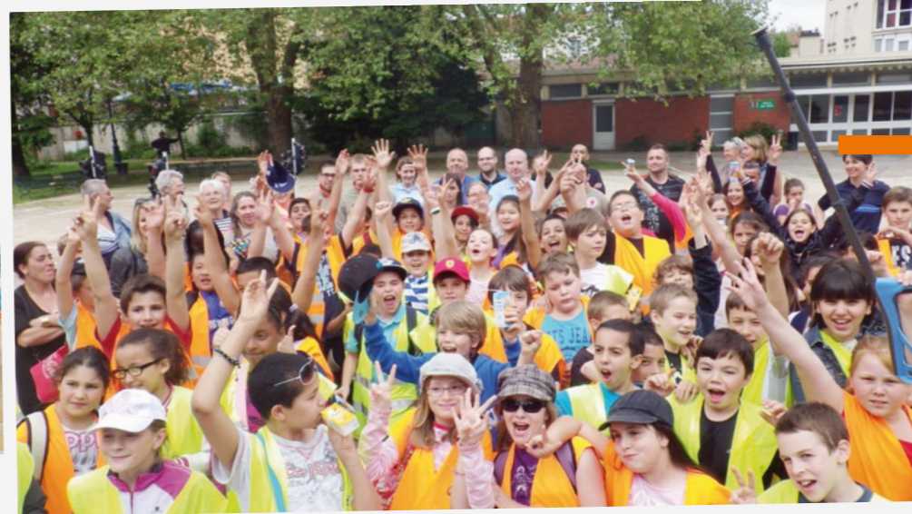
Journée APER et challenge entre les CM2 des trois établissements scolaires de Maxéville. Félicitations aux enfants de l'école Vautrin qui sont arrivés premiers. Chaque enfant a reçu une calculatrice en cadeau.