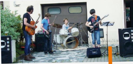
Fête des voisins rue de Lorraine.

Votre fête des voisins a eu lieu après notre date d'édition : envoyez-nous une photo à communication@mairie-maxeville.fr