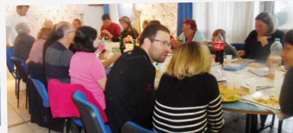
Fête des voisins rue de la Madine.