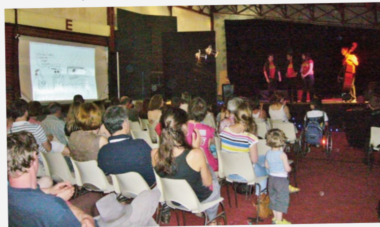
Organisé par la Mairie, le spectacle d'impro-BD proposé par Peb & Fox et la compagnie Crache-Texte a mêlé théâtre et dessins au son d'une contrebasse.