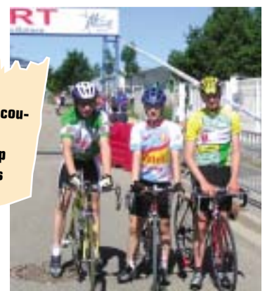
Sous une forte chaleur, 75 coureurs ont pris le départ du championnat régional Ufolep organisé par le Cyclo loisirs Maxéville le 19 juin.