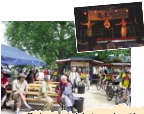
Manèges, spectacle haut en couleur et feux d'artifice...trois des ingrédients forts qui ont fait de cette 23e fête des fraises une réussite.