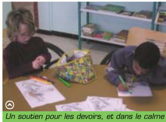
Un soutien pour les devoirs, et dans le calme

Les notes d'informations et bulletins d'inscription sont disponibles en mairie, à l'annexe du CILM et sur www.mairie-maxeville.fr