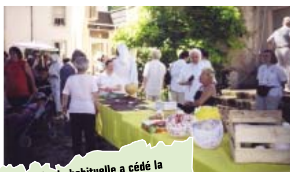
19 juin : La quiétude habituelle a cédé la place à de nombreuses animations dans le parc de la maison de retraite Notre Dame de Bon Repos pour sa journée champêtre annuelle.