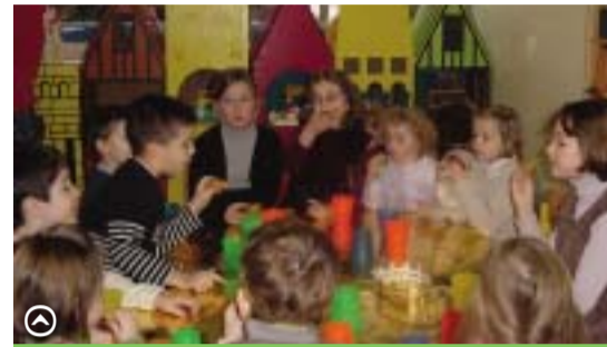
A la ludothèque, les petits s'éveillent

Chacun de ces services favorise aussi l'apprentissage de la responsabilité individuelle et la familiarisation avec la vie collective, deux composantes que Maxéville a bien l'intention de cultiver !