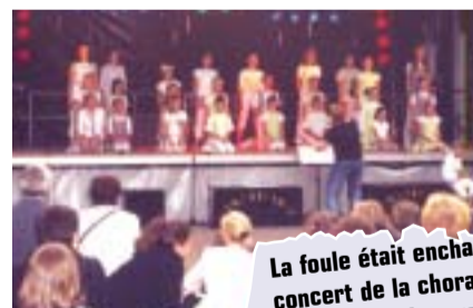
La foule était enchantée de la qualité du concert de la chorale Futures légendes que la mairie avait organisé dans le parc le 11 juin au soir.