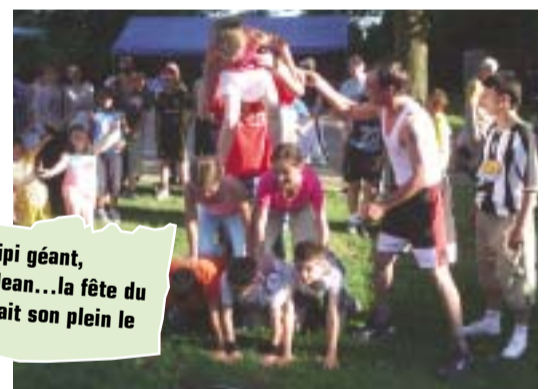
Jeux, spectacle de cirque, tipi géant, concert et feux de la Saint Jean...la fête du quartier champ le Bœuf battait son plein le 18 juin dernier.