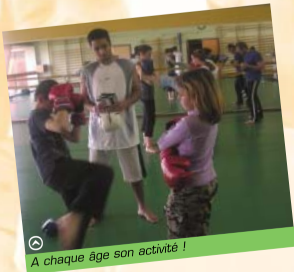
A chaque âge son activité !