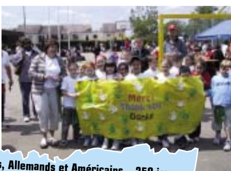
Français, Allemands et Américains...250 jeunes gens se sont sportivement affrontés au complexe Léo Lagrange lors de la dernière rencontre internationale scolaire début juin.