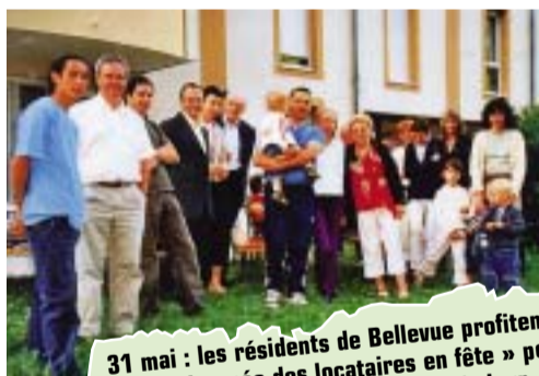
31 mai : les résidents de Bellevue profitent de la « journée des locataires en fête » pour organiser un pique-nique au pied de leur immeuble