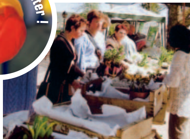
➤ Bourse aux Plantes de maxéville : les visiteurs repartent rarement les mains vides !

Un atelier dégustation suivra, ainsi qu'une démonstration sur pressoir de la fabrication du jus de pomme. La manifestation sera également l'occasion de visiter les jardins «Verger» et «Conservatoire» puisque la Ville de Maxéville a été retenue avec 3 autres communes pour revaloriser deux parcelles dans le cadre de l'OPAV (Opération Programmée d'Amélioration des Vergers).