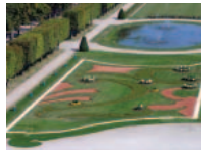
➤ Les bosquets selon Emmanuel Héré à Lunéville

Pleins feux sur le XVIII ème siècle ! Composition et décor du jardin XVIII ème sera le thème développé lors de la campagne «Visitez un jardin en Lorraine». Pour la 18 ème année consécutive, la Lorraine met en valeur et anime ses jardins publics et privés, soutenue par la Région Lorraine, la Drac, la Dren et l'Association PA.J.LOR. Sous leur impulsion, 115 jardins seront ouverts d'avril à octobre.