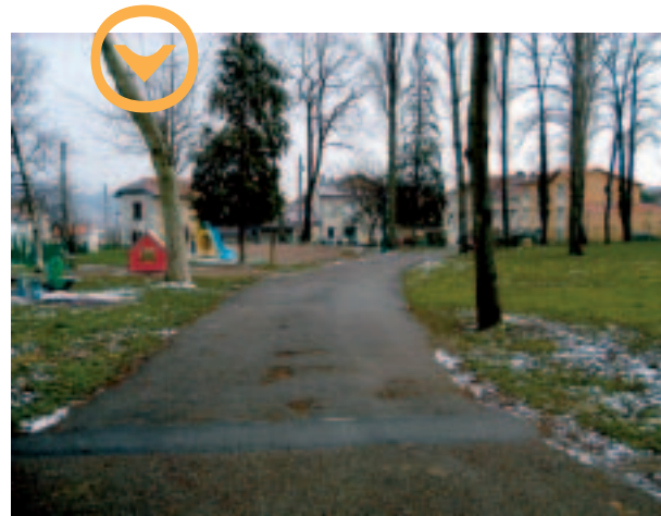
➤ L'allée existante sera déplacée afin d'agrandir l'aire de jeu qui passera de 600 à 1200 m 2

En 2001, la Ville avait le projet de revoir le Parc dans sa globalité et d'acquérir du terrain supplémentaire, ce qui a été réalisé. En 2002, l'extension a été entreprise grâce au terrain se trouvant derrière la Trésorerie Principale et s'est achevée en juin 2003.