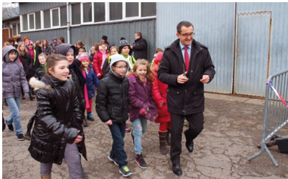
En avant pour inaugurer le char « Circolas »

Maire Vice-Président de la Région Lorraine