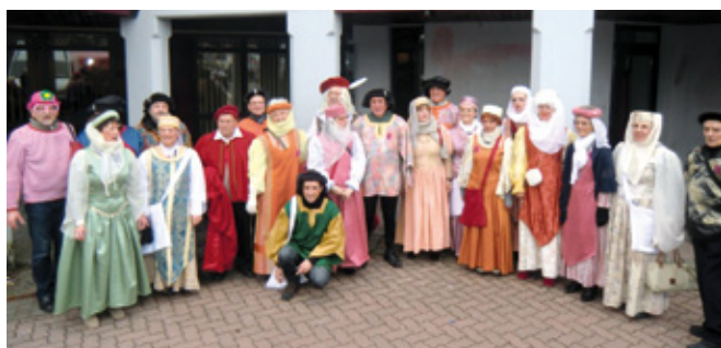
En 2013, déguisement sur le thème de la Renaissance.

L'investissement consacré à la réalisation du char va bien au-delà du défilé de Saint-Nicolas. Le char va vous inspirer pour choisir votre déguisement du carnaval de Ramstein : lion, tigre, otarie ?