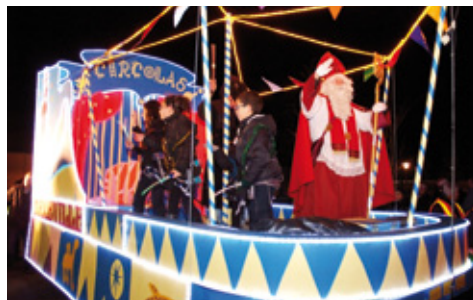
Le char CIRCOLAS lors du défilé de Saint-Nicolas du 10 décembre

La ville de Maxéville a fait participer les enfants de la commune pour la réalisation du char. L'ensemble des décors a été imaginé par les enfants du Centre de loisirs et des écoles de Maxéville grâce à un concours de dessins : ainsi acrobate, tigre, léopard, éléphant et otarie illustrent la piste aux étoiles construite par les bénévoles, les élus et les services techniques de la ville qui ont œuvré depuis le mois de septembre.