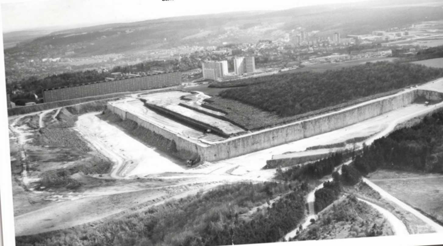
Vue de la carrière sud, du Haut du Lièvre, de l'ouest de Nancy - Carrière Solvay de Maxéville (54) - Vue aérienne - Vers 1966

Vue aérienne en direction du sud-ouest de la Carrière sud. Cette vue met en évidence la nature géologique du gisement de calcaire de Maxéville. À la base, le gisement de calcaire compact, le bûlin d'une épaisseur de 24 mètres. Il est surmonté d'une couche de calcaire argileux de 10 mètres entrecoupée de bancs de calcaire massif : c'est la couche dite calcaire à «Clipeus Ploti» du nom d'un très beau fossile : un oursin aplati qui n'est présent que dans cette couche.