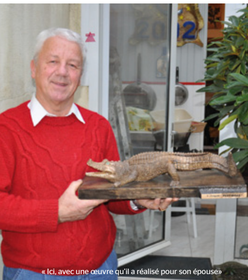
« Ici, avec une œuvre qu'il a réalisé pour son épouse »